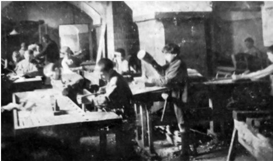
Abb. 3: In der Tischlerwerkstatt lernten die Jungen des Kinderhauses in Kowno, Holz zu bearbeiten. Mit Bildern der handwerkenden Kinder warb die Jüdische Jugendhilfe e. V. um Unterstützung.