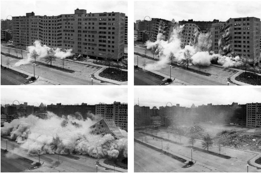
Abb. 2: Zweite Phase des Abbruchs von Pruitt Igoe.

von als individuell angemessener erwarteter Strafe anderen kulturellen Hintergründen entspringen als von über Generationen fortentwickelten Gesetzen und Sanktionskatalogen zugrunde gelegt, müsste nach der realen existierenden und zukünftig zu antizipierenden Kompatibilität von gesellschaftlichen Konformitätserwartungen gefragt werden.