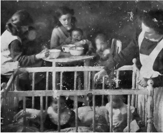
Abb. 2: Im Säuglings- und Kleinkinderheim Lola-Heim in Kowno kümmerten sich ältere um jüngere Kinder. In der geplanten landwirtschaftlichen Kinder- und Jugendsiedlung sollte dieses Prinzip ebenfalls angewendet werden.