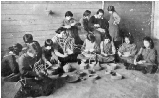
Abb. 4: Die Mädchen des Kinderhauses stellten in der Korbflechterei Gegenstände des täglichen Gebrauchs her.